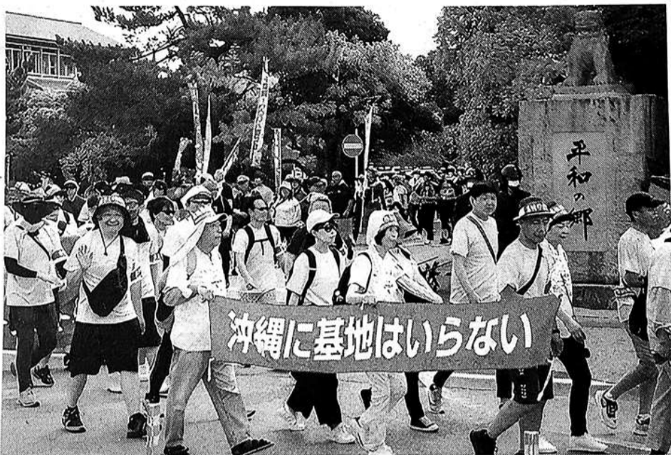
13日，民众在冲绳参加和平游行，要求关闭美国在冲绳的军事基地。

【日本《每日新闻》5月14日报道】13日，冲绳本岛爆发约有2000人参加的“和平游行”，抗议“冲绳自回归以来仍是一座美军基地岛屿”的现状。尽管日本内